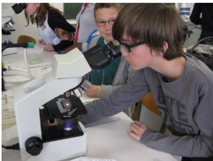
Observation de pollens indicateurs du climat au lycée Corneille.