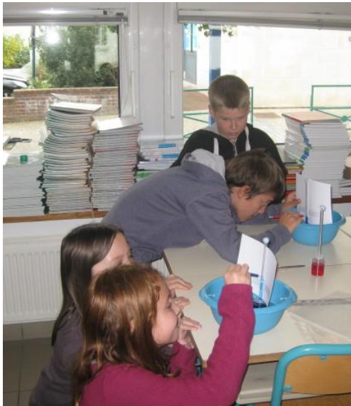
Etalonnage des thermomètres fabriqués par les enfants.