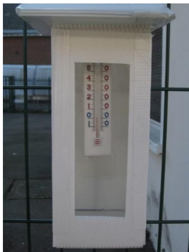
Un abri fabriqué par les enfants.