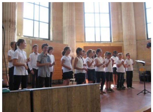
Participation à la fête de la musique durant laquelle les enfants ont chanté leurs textes à la chapelle du collège Fontenelle.