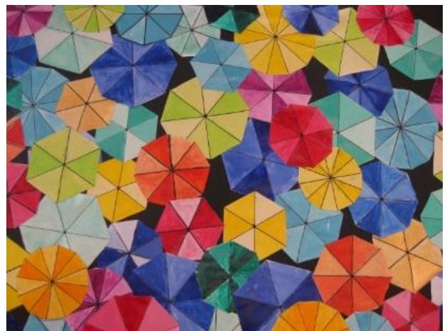
Travail sur les fractions, les figures planes (hexagones et octogones) pour représenter des parapluies vus du ciel.